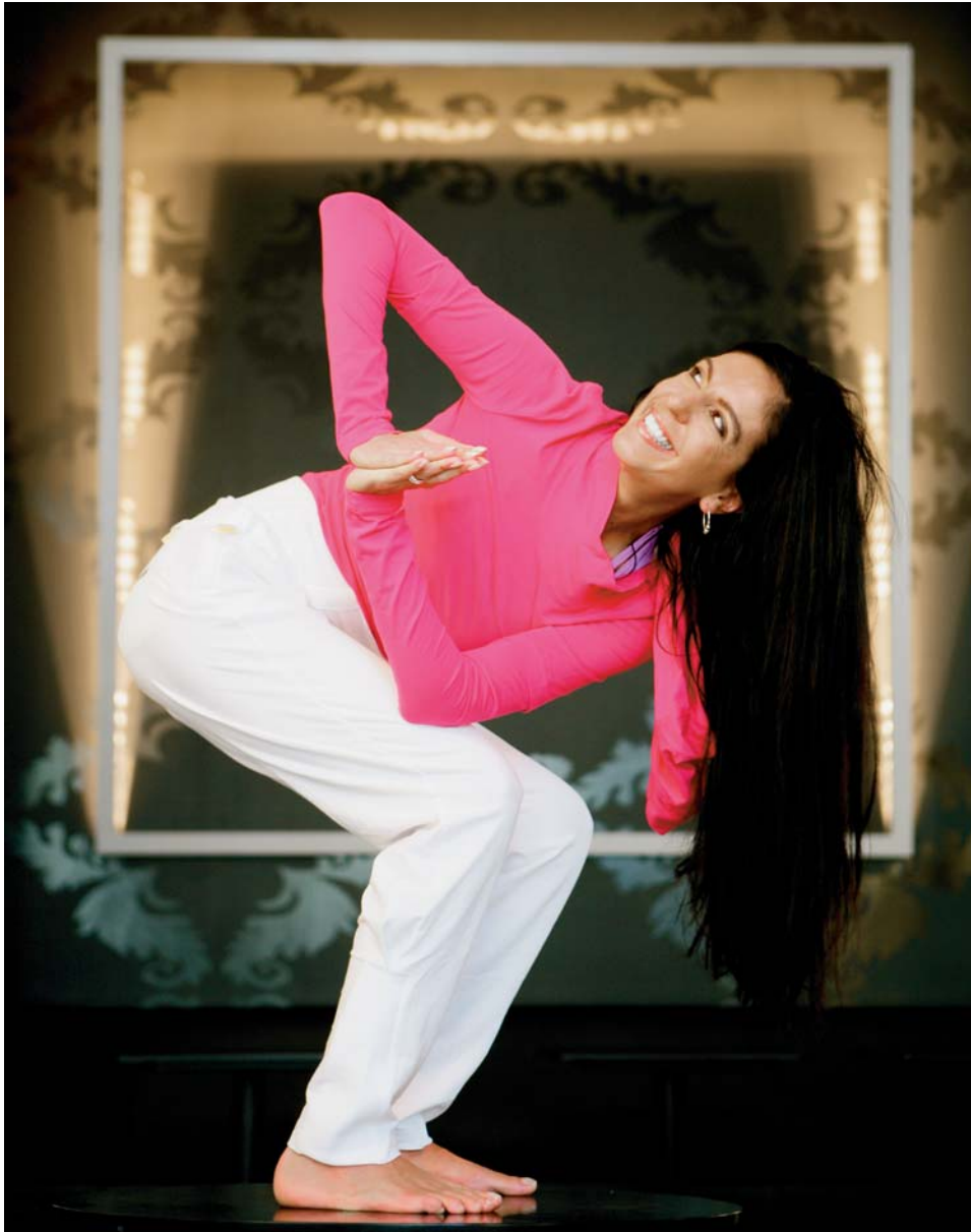
Stella McCartney for Adidas